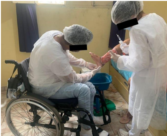
Figura 5 - Discentes realizando a limpeza da área perilesional de uma ferida.