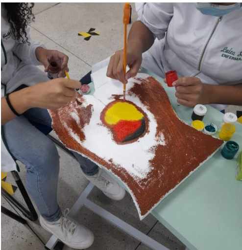
Figura 2 - Feridas na região sacral, Cuité, PB, Brasil, 2022.

além de tecido de granulação no leito da ferida, bordas irregulares com área perilesional hiperemiada.