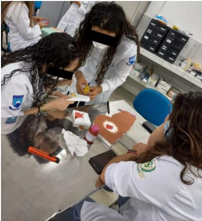
Figura 1 - Ferida na região trocantérica direita.