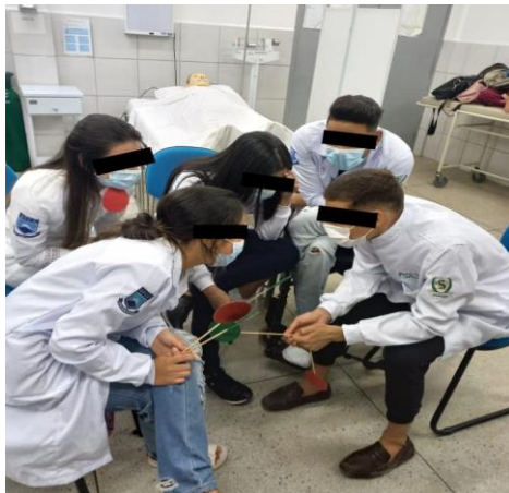
Figura 4 - Discentes durante o jogo das plaquinhas.