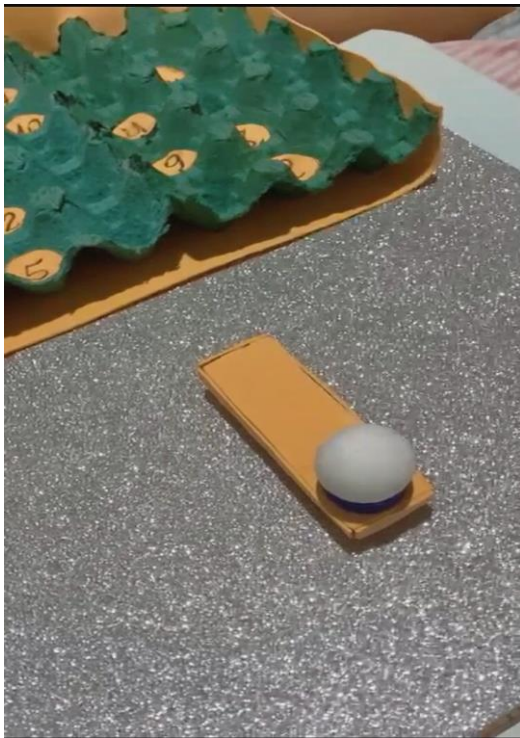
Figura 3 - Trampolim da Orem. Cuité, Paraíba, Brasil, 2022