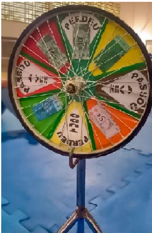
Figura 1 - Roleta roda, roda Nightingale. Cuité, Paraíba, Brasil, 2022