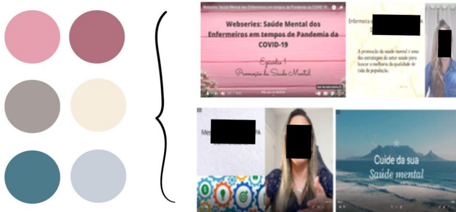
Figura 4 - Layout e imagens do vídeo

imagens dialogam com paisagens calmas como de mar, assim como usou-se o recurso de diálogo para discorrer sobre o tema como observado na Figura 4.