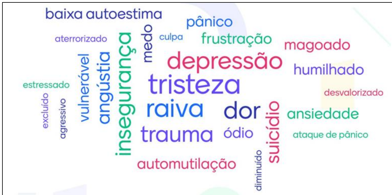
Figura 1- Nuvem de palavras. Rio de Janeiro, RJ, Brasil, 2023

Assim, por meio da arte, os adolescentes puderam expressar o que uma pessoa que já sofreu bullying pode sentir. Destaca-se também, que além das palavras mais recorrentes, observamos expressões como angústia, baixa autoestima, humilhado, vulnerável, ansiedade, dor emocional, além de atos como a automutilação e suicídio. Tais sentimentos reforçam a gravidade do impacto do bullying na vida dos adolescentes.